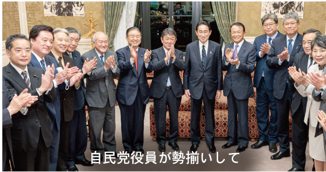
自民党役員が勢揃いして

2ヶ月以上にわたる臨時国会を終えました。経済やデジタル、警察、少子化対策、新型コロナ対策など幅広い分野を担当する内閣委員会の責任者である筆頭理事として、多くの重要法案を成立させたほか、物価高騰対策や賃上げを実現するための補正予算を成立させました。