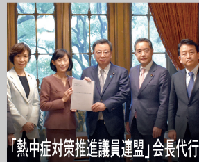
「熱中症対策推進議員連盟」会長代行