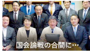
国会論戦の合間に…

実は、茂木敏充幹事長と私は同じ10月7日が誕生日であり、幹事長室メンバーにお祝いしてもらいました。