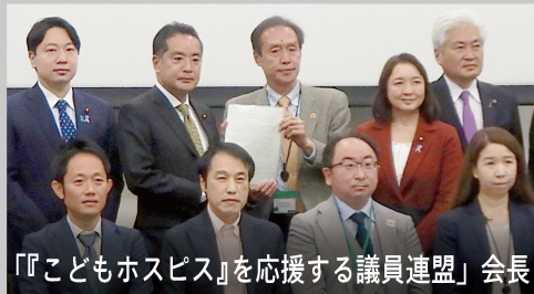
『こどもホスピス』を応援する議員連盟 会長