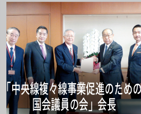
「中央線複々線事業促進のための国会議員の会」会長