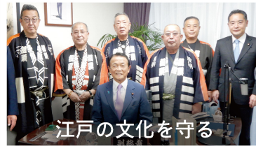
江戸の文化を守る

実は、茂木敏充幹事長と私は同じ10月7日が誕生日であり、幹事長室メンバーにお祝いしてもらいました。