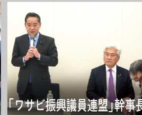
「ワサビ振興議員連盟」幹事長