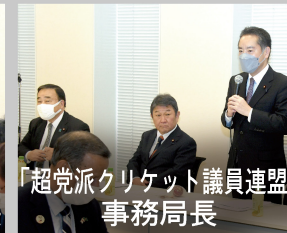
「超党派クリケット議員連盟」事務局長