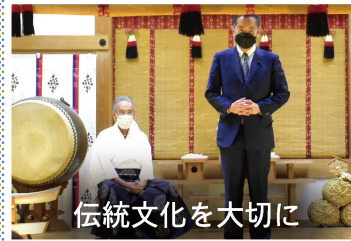
伝統文化を大切に

青梅市の武蔵御嶽神社で行われた御神楽を見に行ってきました。200年以上、宮司さんたちが大切に伝承してきた、御岳山に伝わる貴重な文化・芸能です。