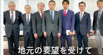
地元の要望を受けて

西多摩8市町村の市町村議会議長の皆さまと、地域の課題について意見交換を行いました。国・都・市町村が一致協力して取り組んでまいります。