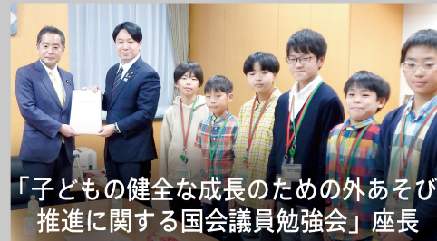
「子どもの健全な成長のための外あそび推進に関する国会議員勉強会」座長