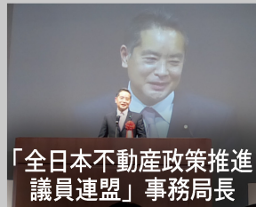
「全日本不動産政策推進議員連盟」事務局長

西多摩8市町村の市町村議会議長の皆さまと、地域の課題について意見交換を行いました。国・都・市町村が一致協力して取り組んでまいります。