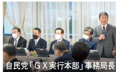
自民党「GX実行本部」事務局長

また、台湾を訪問して国慶節の祝賀パレードに参加したり、EUの環境大臣と会談するなど、議員外交も推進しています。