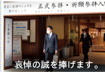
哀悼の誠を捧げます。

青梅市の武蔵御嶽神社で行われた御神楽を見に行ってきました。200年以上、宮司さんたちが大切に伝承してきた、御岳山に伝わる貴重な文化・芸能です。