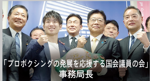
「プロボクシングの発展を応援する国会議員の会」事務局長