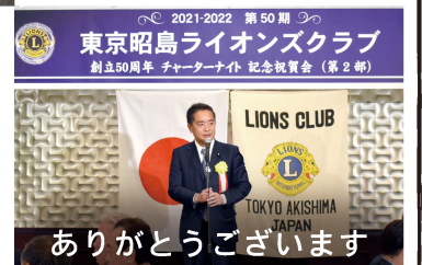
ありがとうございます

昭島市の「フォレストイン昭島館」において、「東京昭島ライオンズクラブ創立50周年記念式典」が挙行されました。半世紀もの地域貢献に感謝です。