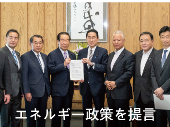
エネルギー政策を提言

ロシアのウクライナ侵攻によるエネルギー・物価高騰対策、外交・安全保障、新型コロナ対策、そして憲法改正など、国政の重要課題は山積しています。