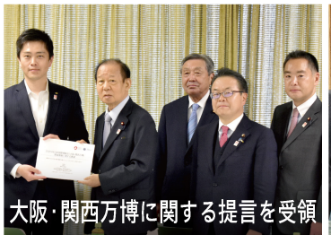
大阪・関西万博に関する提言を受領