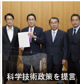
科学技術政策を提言