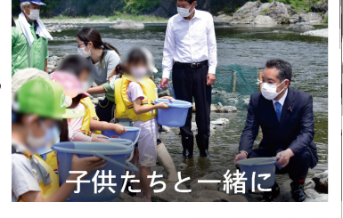
子供たちと一緒に

青梅市釜の淵公園における「奥多摩川友愛会」による鮎の放流に参加しました。子供たちが地域の自然や動植物と触れ合う事もとても大切です。