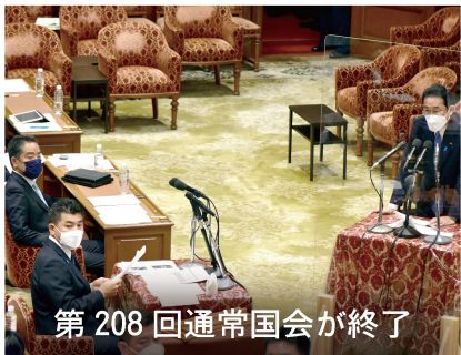
第208回通常国会が終了