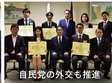
自民党の外交も推進