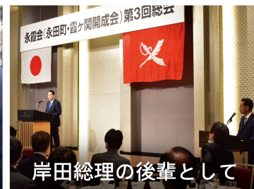
岸田総理の後輩として

「都市農業研究会」会長として、東京をはじめとする都市部の農業を守り育てるために、様々な政策を進めています。