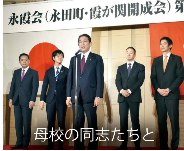
母校の同志たちと

「自民党税制調査会」の幹事として東京税理士会主催の「パネルディスカッション」に出席し、来年度の税制改正などについて議論しました。