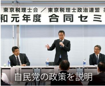
自民党の政策を説明

「自民党中古住宅市場活性化委員会」の委員長として、老朽化したマンションの管理の適正化や建替え促進のための法案を立案しました。