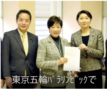
東京五輪パブリックで

衆議院内閣委員会の責任者である筆頭理事として、新型コロナ対策の他に「桜を見る会」やカジノ事件などにも対応しています。