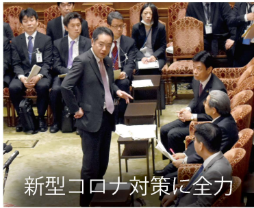
新型コロナ対策に全力

衆議院内閣委員会の責任者である筆頭理事として、新型コロナ対策の他に「桜を見る会」やカジノ事件などにも対応しています。