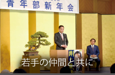
若手の仲間と共に

「福生・羽村倫理法人会」の「経営者モーニングセミナー」で講演しました。私の政策や考えを国民の皆さまに伝えるため、各地で講演を行っています。