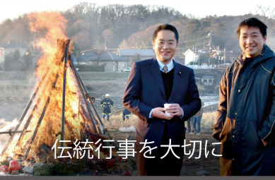
伝統行事を大切に

「秋川リトルリーグ新年球始め」に参加し、子供たちやご家族、スタッフの皆さまを激励しました。事故の無いように気をつけて、寒さに負けず、頑張ってください！