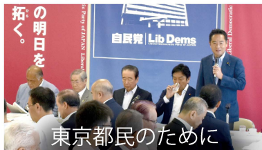
東京都民のために

奥多摩町から「文化団体連盟」の皆さんが国会見学に来てくれました。国会見学のご要望も随時受け付けていますので、お気軽にお声かけください。