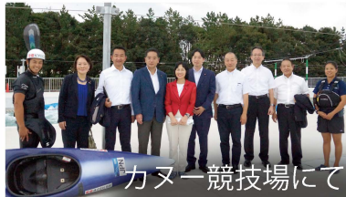
カヌー競技場にて

来年度の予算や税制改正について、40団体から合計約14時間ものヒアリングも行いました。あらゆる分野の課題を把握し、政策立案に活かしてまいります。