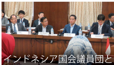
インドネシア国会議員団と

私が所属する政策グループ「志公会（麻生派）」の夏期研修会が開催されました。憲法改正等に関する討論や、神奈川県警察本部の視察等も実施されました。