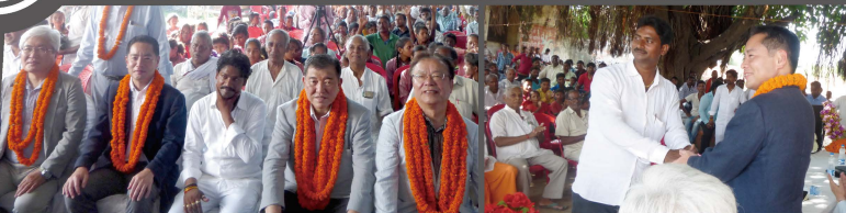
議員連盟でインドへ