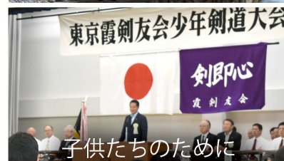
子供たちのために