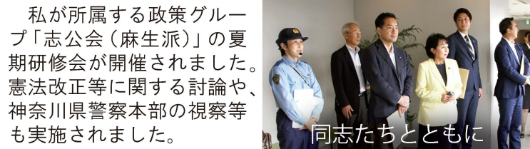
同志たちとともに

奥多摩町から「文化団体連盟」の皆さんが国会見学に来てくれました。国会見学のご要望も随時受け付けていますので、お気軽にお声かけください。