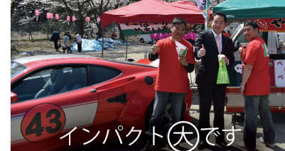
インパクト大です

毎年、塩船観音寺の「つつじ祭り」にて行われる「火渡り荒行」にも参加しています。青梅市東部地区の観光振興のため、身体を張って頑張っています!?