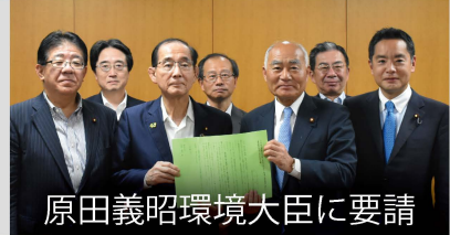
原田義昭環境大臣に要請

「森林を活かす都市の木造化推進議員連盟」を設立し、幹事に就任しました。日本の美しい森林を守り育てて行くためには、都市と地方の連携も大切です。