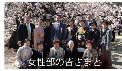
女性部の皆さまと

「令和」となって初めての青梅大祭。JR青梅駅前ロータリーでの式典や提灯行列、花火等の企画により、例年以上に大いに盛り上がる事ができました!