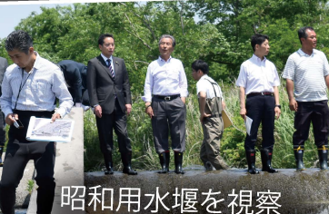
昭和用水堰を視察

国や東京都、昭島市・あきる野市・日野市等と「江戸前鮎を復活させる地域協議会」を設立し、私が座長を務めています。魚道の改善等により、鮎の遡上を実現します。