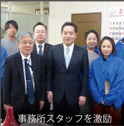
事務所スタッフを激励