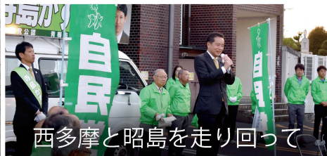
西多摩と昭島を走り回って

4月21日に統一地方選挙の後半戦が行われました。東京25区においても、檜原村では村長選挙が、青梅市・昭島市・福生市・羽村市・瑞穂町・檜原村の6市町村では議会議員選挙が実施されました。50名以上の自民党系候補者の応援に走り回り、おかげさまでほぼ全員の当選を勝ち取ることができました！