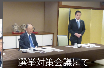
選挙対策会議にて