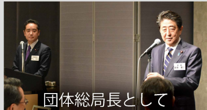
団体総局長として

自民党団体総局長として、600近い全国の友好団体との懇談会を6回に分けて主催しました。私が司会を務め、安倍晋三総裁にも全回出席してもらいました。