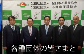
各種団体の皆さまと

自民党団体総局長として選挙対策に奔走しています。参議院議員選挙の16激戦区である青森、岩手、秋田、宮城、山形、福島、新潟、山梨、長野、滋賀、三重、愛媛、徳島・高知、佐賀、大分、沖縄を全て訪問し、各県連の幹部らと率直な意見交換を重ねています。また、大阪や沖縄の衆議院補欠選挙でも現地を度々訪問し、各種団体や企業等に支援を要請しました。