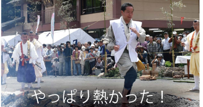
やっぱり熱かった!

毎年、塩船観音寺の「つつじ祭り」にて行われる「火渡り荒行」にも参加しています。青梅市東部地区の観光振興のため、身体を張って頑張っています!?