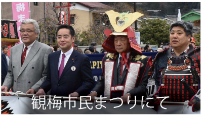
観梅市民まつりにて

青梅市で発生した梅輪紋ウィルス対策に長年取り組み、ついに再植樹を実現することができました。「梅の里の再生」のため、市民みんなで頑張りましょう!