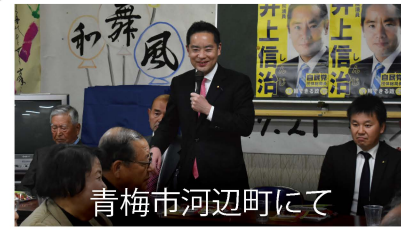
青梅市河辺町にて

青梅市で発生した梅輪紋ウィルス対策に長年取り組み、ついに再植樹を実現することができました。「梅の里の再生」のため、市民みんなで頑張りましょう!