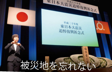
被災地を忘れない

福島第一原発事故を担当する環境兼内閣府副大臣を3年間務めて以来、毎年3月11日には政府主催の東京の式典ではなく、あえて福島の追悼式典に参列し続けています。