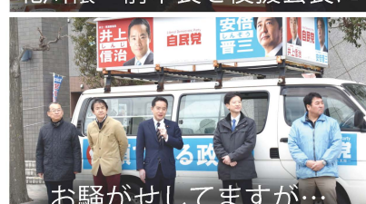
お騒がせしていますが...

福生市の「リングサイドフィットネスジム」を訪問しました。子供達にもボクシングを教えて、夢は「福生から世界チャンピオン誕生！」です。