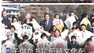
子供たちに伝統文化を

自民党あきる野市議会議員の同志と市内の街頭遊説活動を実施しました。選挙の時だけでなく、常日頃から国民の皆さまに自民党の政策を訴えています。