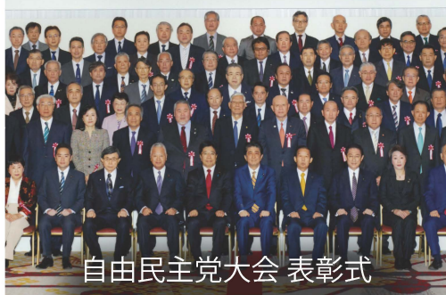
自由民主党大会 表彰式

全国の業界団体や企業、NPO等と自民党との連携の総責任者である団体総局長は3年目となります。総裁特別表彰を受けられる友好団体の皆さまと安倍晋三総裁はじめ党役員との記念撮影も早や3年目となり、慣れたものです!?