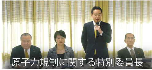
原子力規制に関する特別委員長

「FCVを中心とした水素社会実現を促進する研究会」幹事長として、環境・エネルギー問題にも取り組んでいます。