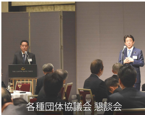
各種団体協議会 懇談会

全国の業界団体や企業、NPO等と自民党との連携の総責任者である団体総局長は3年目となります。総裁特別表彰を受けられる友好団体の皆さまと安倍晋三総裁はじめ党役員との記念撮影も早や3年目となり、慣れたものです!?