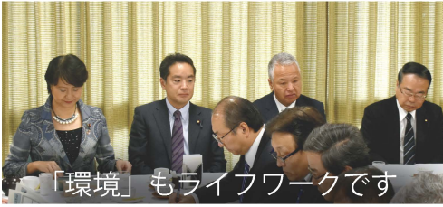
「環境」もライフワークです

福島第一原発事故の収束を担当する環境兼内閣府副大臣を3期務めて以来、ライフワークとして取り組んでいます。