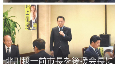
北川穰一前市長を後援会長に

毎年、節分には地元の10数カ所の寺社で豆まきに参加しています。日本の大切な伝統文化を守り、次世代にもきちんと伝えていかなければなりません。