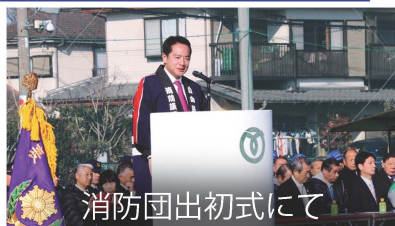
消防団出初式にて

自民党東京25区青年部では、毎年恒例の新年会を約400人の若手の同志と開催しました。統一地方選挙と参議院選挙の必勝を一致団結して誓い合いました。