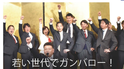
若い世代でガンバロー！

自民党東京25区青年部では、毎年恒例の新年会を約400人の若手の同志と開催しました。統一地方選挙と参議院選挙の必勝を一致団結して誓い合いました。