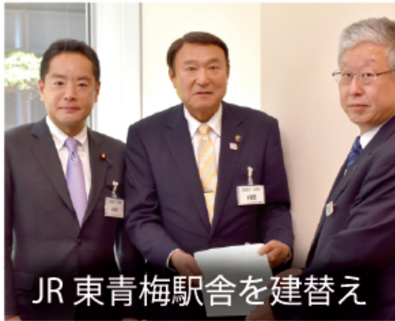
JR 東青梅駅舎を建替え

環境省等との調整に奔走し、「檜原村エコツーリズム推進全体構想」の認定を受けることができました。檜原村の美しく豊かな自然や伝統文化、美味しい特産品等を活用し、村おこしを進めてまいります。