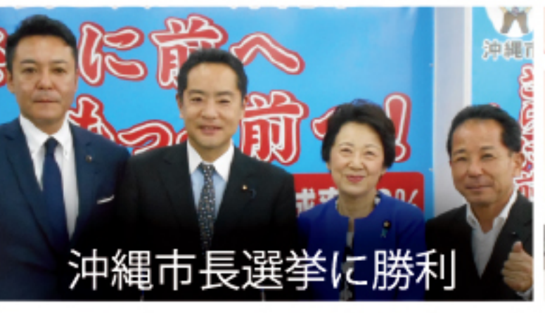
沖縄市長選挙に勝利