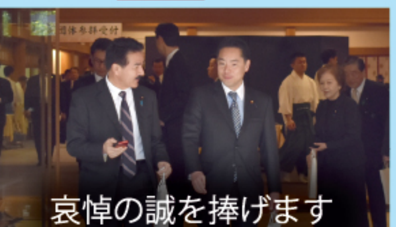
哀悼の誠を捧げます

毎年、終戦記念日と春秋の例大祭には必ず靖国神社に正式参拝しています。不戦の誓いと平和の尊さを次の世代にも伝えていかなければなりません。