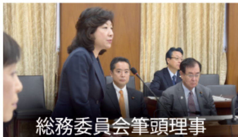
総務委員会筆頭理事

二階俊博幹事長の記者会見に同席するのも副幹事長の大切な仕事の1つです。国民からの疑念を払拭するためには丁寧な説明に努めなければなりません。