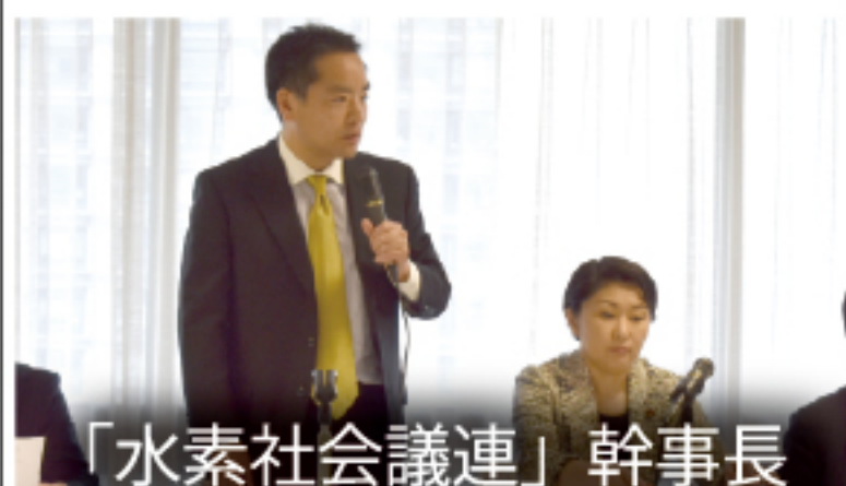
「水素社会議連」幹事長

自民党とあらゆる団体との連携の総責任者である団体総局長として、全国各地のさまざまな式典やイベント等に、自民党を代表して出席しています。