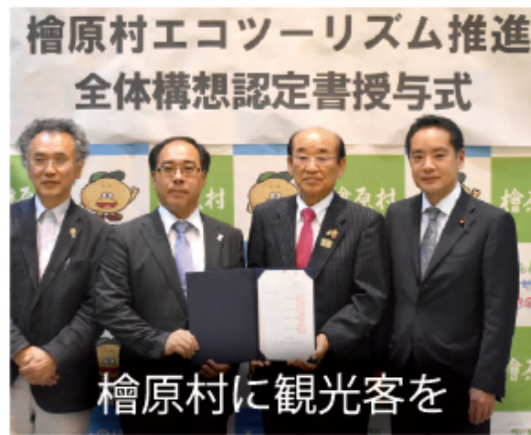
檜原村に観光客を

三多摩の自民党国会議員ら14名で「中央線複々線事業促進のための国会議員の会」を設立し、私が会長に就任しました。青梅線、五日市線、八高線も含め、増便や混雑緩和等のために取り組んでまいります。