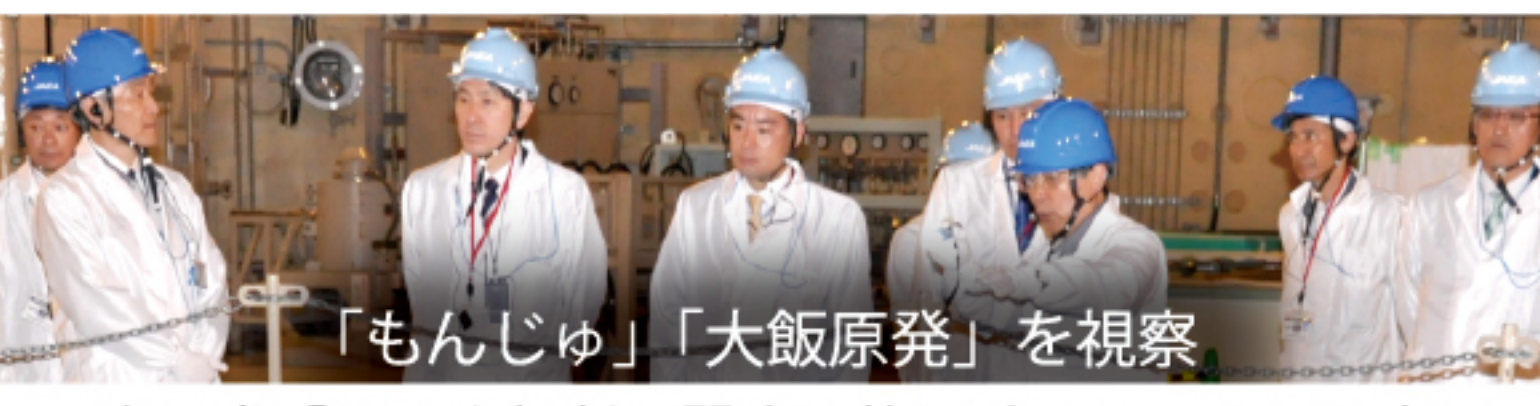
「もんじゅ」「大飯原発」を視察

自民党「原子力規制に関する特別委員長」として全国各地の原子力施設を全て回り、地元の首長や議員、住民等と意見交換を重ねています。何と云っても安全性が最優先であり、自らの目で厳格なチェックを行っています。