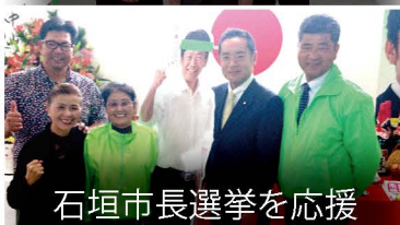
石垣市長選挙を応援

自民党団体総局長として、全国各地の選挙応援に行っています。沖縄県名護市は在日米軍普天間基地の移設先である辺野古の所在市として、国政上も重要な一戦でした。