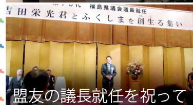
盟友の議長就任を祝って

環境副大臣を3年間務め、被災者の皆さまのために全力で取り組んできました。毎年3/11には政府主催の追悼式ではなく、あえて福島での追悼式に参列し続けています。