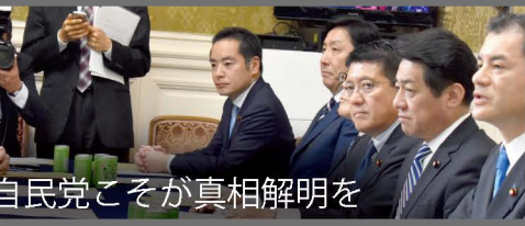
自民党こそが真相解明を

自民党副幹事長として、国民からの信頼を取り戻すため、森友問題の徹底的な真相解明や責任追及を行う「財務省公文書書き換え調査PT」を立ち上げました。