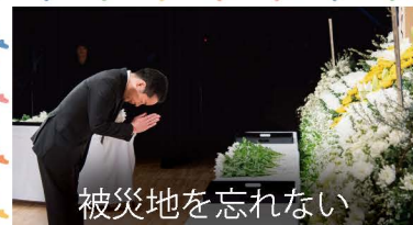
被災地を忘れない

環境副大臣を3年間務め、被災者の皆さまのために全力で取り組んできました。毎年3/11には政府主催の追悼式ではなく、あえて福島での追悼式に参列し続けています。