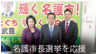
名護市長選挙を応援

自民党原子力規制に関する特別委員長として全国の原発に赴き、安全性のチェックなどを行うとともに、地元の首長や議員、住民の方々など意見交換を行っています。