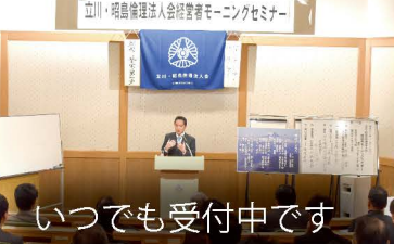
いつでも受付中です

多くの子供たちと一緒に、凧の手作りと凧揚げ大会に参加しました。私たち大人が責任を持って、日本の古き良き伝統文化を次世代に伝えていかなければなりません。