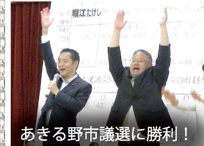
あきる野市議選に勝利!

「少数激戦」となったあきる野市議会議員選挙では、多くのご支援を受け、おかげさまで私が応援した保守系候補 9 人は全員当選することができました。