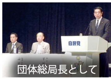
団体総局長として

540 以上ある自民党の友好団体との連携の責任者である団体総局長として、各団体からの要望の聴取や選挙・献金の依頼などを行っています。