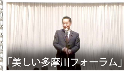
「美しい多摩川フォーラム」

私が顧問を務める「美しい多摩川フォーラム」の総会に出席しました。多摩川の環境や景観保全、子供たちの教育、地域活性化などに取り組む素晴らしい活動です。