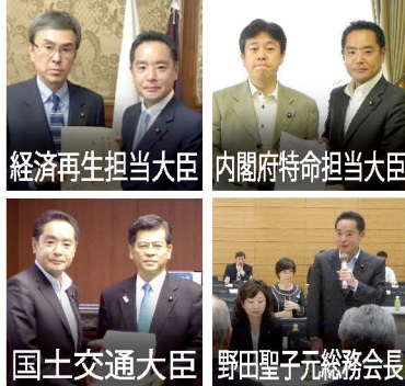
経済再生担当大臣

自民党「中古住宅市場活性化小委員会」委員長として空き家・空き地対策に関する提言を取りまとめ、関係大臣や議員連盟、業界団体などに政策の実現を強く要請しました。