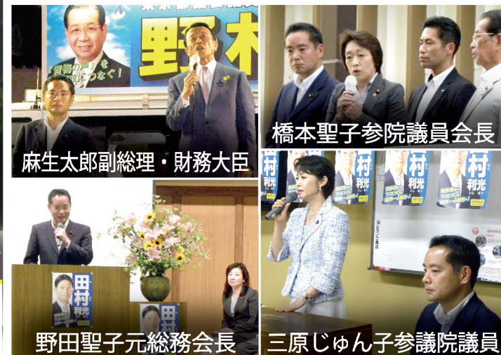
麻生太郎副総理・財務大臣