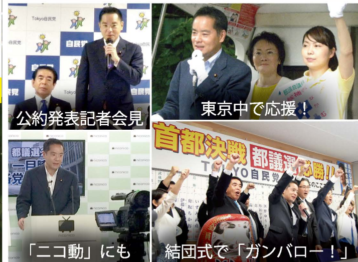
公約発表記者会見