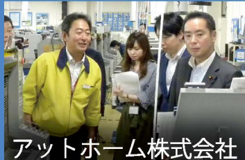
アットホーム株式会社

中古住宅流通の現場として、情報ビラの印刷工場、総合データベース、コールセンターを視察しました。実効的な政策を作るため多くの現場に赴いています。