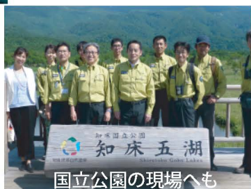
国立公園の現場へも

美しい自然や生態系を守るため、全国の国立公園を適正に管理しています。増えすぎたシカやイノシシなどの鳥獣被害対策にも取り組んでいます。