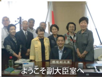
ようこそ副大臣室へ

就任以来、多くの方々に環境副大臣室を訪問してもらっています。内閣改造までの期間限定なので、ご希望の方はお早めにご連絡ください!?