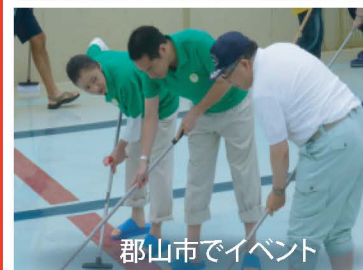
郡山市でイベント