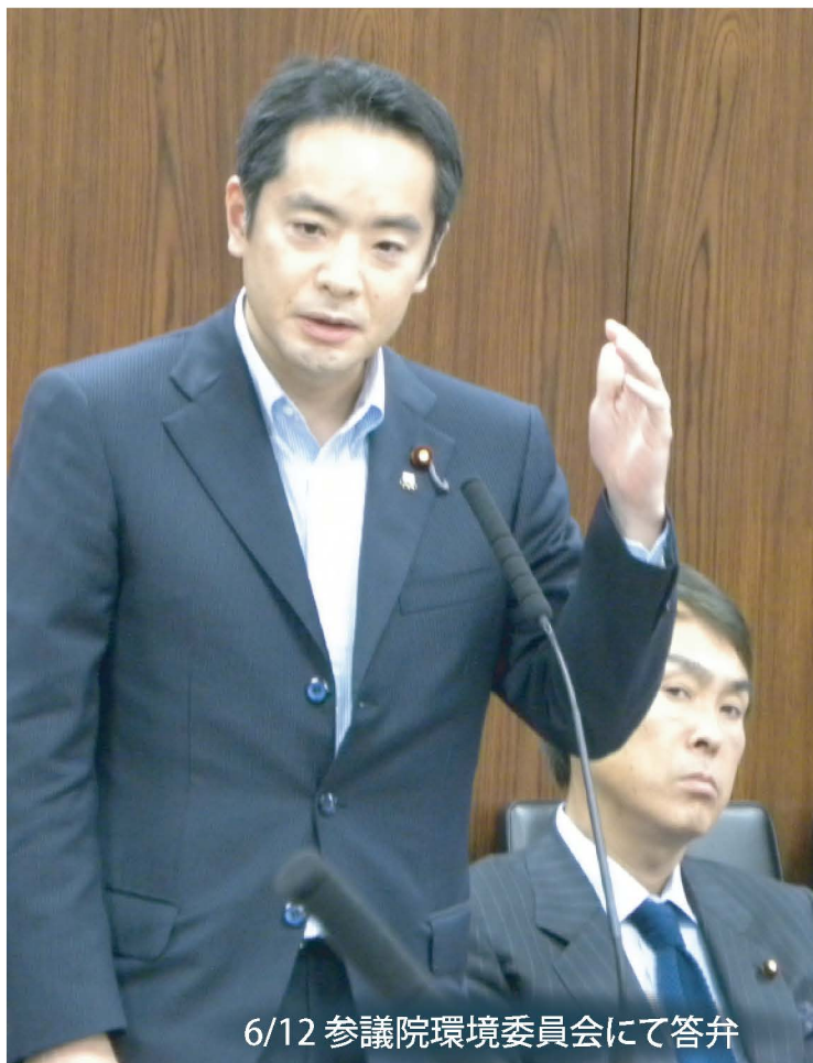
6/12 参議院環境委員会にて答弁

第2次安倍内閣が発足し、環境兼内閣府副大臣に就任してから早や1年8ヶ月、厳しくも充実した毎日を過ごしています。