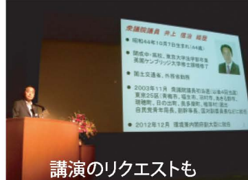
講演のリクエストも

おかげさまで環境副大臣としての講演依頼も多く、「羽村市環境フェスティバル」でも特別講演を行いました。こちらも期間限定なので、お早めに!?