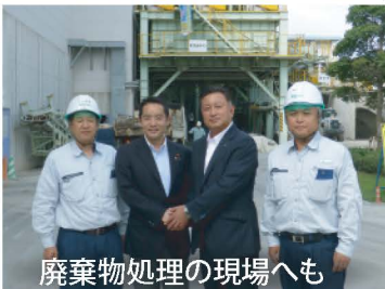
廃棄物処理の現場へも

東日本大震災や伊豆大島の台風被害などで発生した膨大な災害廃棄物は、全国の処理施設で受け入れていただきました。心から感謝です。