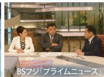
BSフジ「プライムニュース」