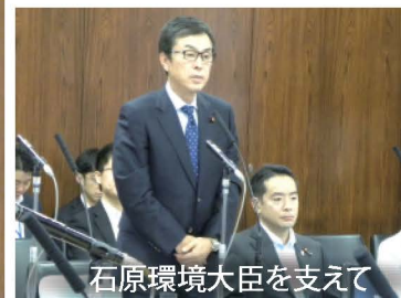
石原環境大臣を支えて

環境副大臣の仕事はとても幅広く、多忙な激務です。国会や陳情への対応、国内外の会議やイベントの出席、メディア出演などに忙殺されつつ、官僚たちを率いて環境行政を推進しています。