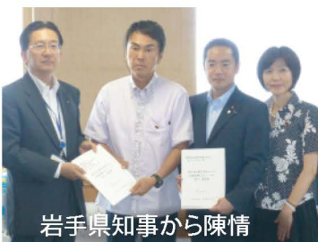
岩手県知事から陳情

国民が望む環境行政を実現するため、政策や予算に関する、全国の首長や議会、各種団体などからの陳情には、なるべく多く対応しています。