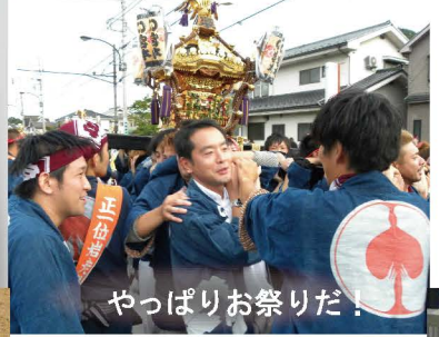
やっぱりお祭りだ!

公務の合間を縫って今年も西多摩中約50カ所の秋祭り等に参加しました。地域に伝わる伝統文化を大切に。