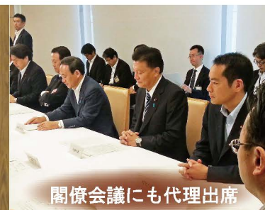
閣僚会議にも代理出席