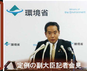
定例の副大臣記者会見