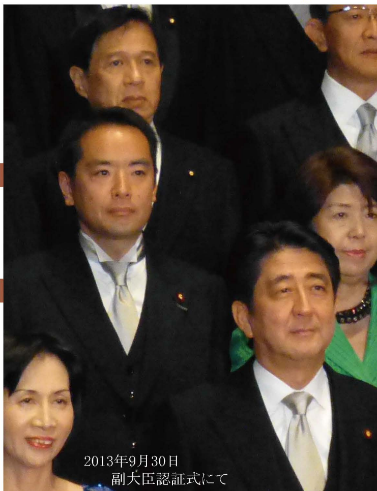
2013年9月30日 副大臣認証式にて

第2次安倍内閣の副大臣・大臣政務官が刷新されましたが、私は、原発事故等を担当する環境兼内閣府副大臣に再任されました。異例ではありますが、福島をはじめとする被災者の皆さんにとっても、政府の責任者がコロコロ替わるべきではなく、大変嬉しく思います。 引き続き、除染や中間貯蔵施設、放射性廃棄物の処分、PM2.5等の困難な課題に全力で取り組んで参ります。