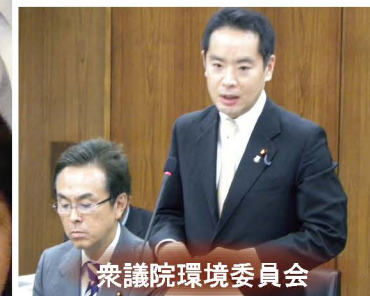
衆議院環境委員会

久しぶりの安定政権であるからこそ、野党の方々の声も真摯に受け止めながら、被災地の復興、経済再生、外交・安全保障の再建等の大きな課題に立ち向かい、実現しなければなりません。