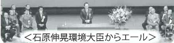
<石原伸晃環境大臣からエール>