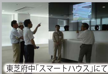
東芝府中「スマートハウス」にて

過去の原発推進を謙虚に反省し、我が国のエネルギー政策を見直さなければなりません。環境副部長として、省エネや再生可能エネルギーの導入を進めています。