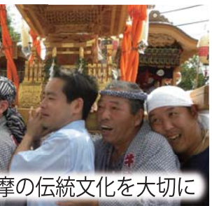
西多摩の伝統文化を大切に

今年も、西多摩各地で行われた夏祭り約100ヶ所に参加しました。地域に伝わる伝統行事をきちんと継承して行くことが、日本の再興にも繋がると信じています。