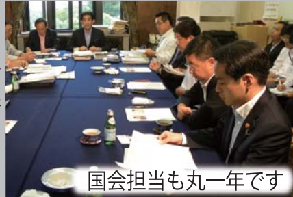
国会担当も丸一年です

国会対策副委員長として、早朝から夜遅くまで国会に詰めています。国会対応の司令塔・現場の最前線として、自党内の調整や政府・与野党協議等に全力投球しています。