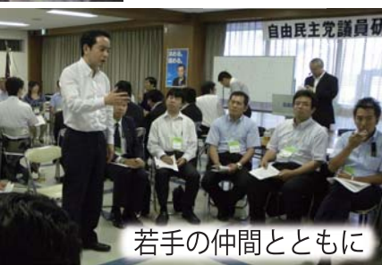
若手の仲間とともに

今年の統一地方選挙でも、多くの新人地方議員を当選させていただきました。国民の期待に応えるため、今後4年間が大切です。早速、研修会を行いました。