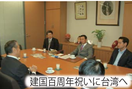
建国百周年祝いに台湾へ

今年は中華民国建国百周年の記念すべき年です。馮寄台大使の招請により、麻生太郎総理大臣をはじめ、日台交流を担ってきた歴代青年局長と一緒に訪台します。