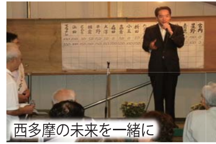
西多摩の未来と一緒に

日の出町議会議員選挙においては、私が応援した自民党推薦候補者9名中8名を当選させていただきました。多くのご支援、本当にありがとうございました。