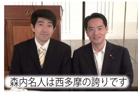
森内名人は西多摩の誇りです

あきる野工藤将棋道場出身の森内俊之九段が名人位を奪還しました。今でも子供たちに気軽に将棋を教える森内名人も、西多摩の同世代の大切な仲間です。おめでとう!