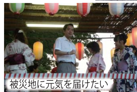
被災地に元気を届けたい

さらに、各地区の盆踊り大会にも200ヶ所近く参加させていただきました。被災地に元気を送り届けようと、地元の皆さまと一緒に大いに盛り上がる事ができました。