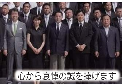
心から哀悼の誠を捧げます

今年も、終戦記念日に東京都連青年部の仲間約100名と靖国神社を参拝しました。私たち若い世代こそが、国を守った先達に思いを至さなければなりません。