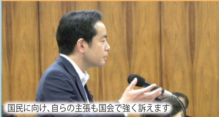
国民に向け、自らの主張も国会で強く訴えます