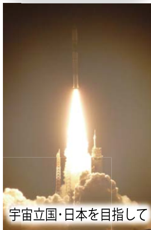
宇宙立国・日本を目指して

鹿児島県の種子島宇宙センターから、人工衛星「みちびき」の打ち上げに成功しました。私も、国家宇宙戦略を進めた自民党内閣部会長として、この歴史的時間に立ち会いました。