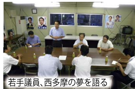
若手議員、西多摩の夢を語る

40 代以下の西多摩 8 市町村の若手地方議員約 10 人でグループを結成しました。私たち若手が一致協力し、責任を持って未来の西多摩を創ります。