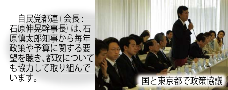
国と東京都で政策協議

今年の終戦記念日は、青年局から強く要請し、自民党を代表して谷垣禎一総裁、大島理森幹事長と 3 名で靖国神社に参拝しました。心から哀悼の誠を捧げます。