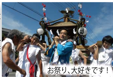
お祭り、大好きです！

この夏も、西多摩の盆踊りやお祭りに 200 ヶ所近く参加させていただきました。皆さまと一緒に、大切な地元の伝統文化を盛り上げてまいります。