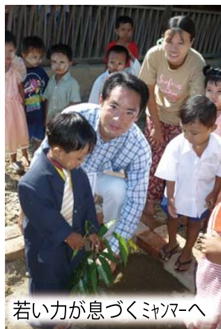
若い力が息づくミャンマーへ

未だ軍部の独裁政権が続くミャンマー（旧ビルマ）においても、子供たちは元気に育っています。早期の民主化を要請するとともに、草の根の農業支援を行ってきました。