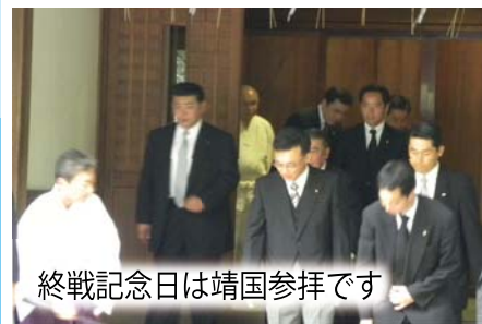
終戦記念日は靖国参拝です

自民党青年局幹部約 30 名を率いて台湾を訪問しました。日本の固有の領土である尖閣諸島の問題について強く抗議するとともに、政権奪還を実現した台湾国民党の取り組みを聴取し、谷垣禎一総裁にも報告できました。