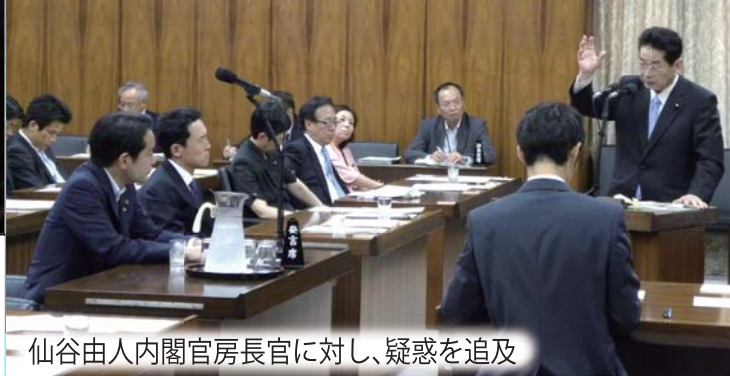
仙谷由人内閣官房長官に対し、疑惑を追及