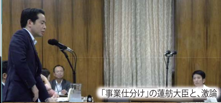
「事業仕分け」の蓮舫大臣と、激論