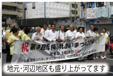
地元・河辺地区も盛り上がってます

青梅ふれあい祭りは、地元の人たちが大変な苦勞をして始めた手作りのお祭りです。私も家族 5 人で河辺に住む住民仲間として、全面的に協力しています。