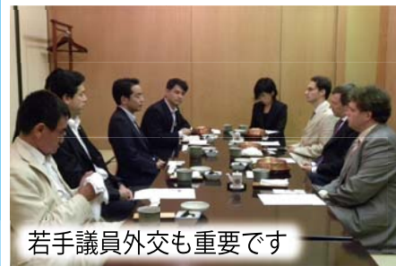
若手議員外交も重要です

3 年間務めた青年局長を退任することになりました。東奔西走で大変でしたが、おかげさまで全国各地に多くの仲間を作り、世代交代も進めることができました。