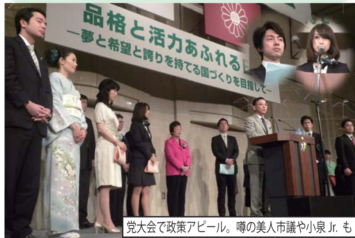
党大会で政策アピール。噂の美人市議や小泉 Jr. も

「日本が危ない。このままでは世界からも取り残されてしまふ。」古い政治の体質を打ち壊し、新しい時代を創り上げていくのは、私たち若い世代です。今こそ新しい自民党に集う多くの若手の仲間と共に立ち上がります!