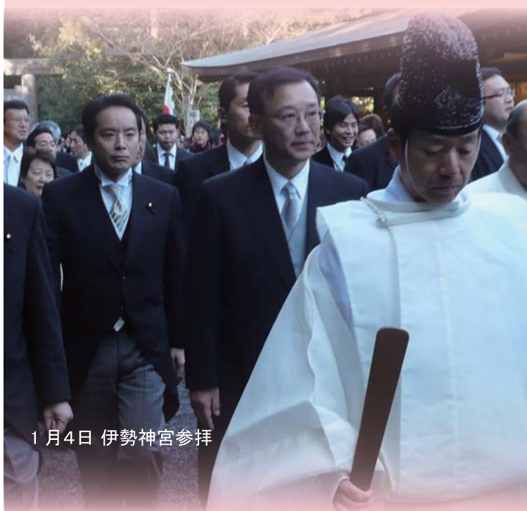
1月4日 伊勢神宮参拝

新たな年を迎え、気持ちも新たに多くの 難題に取り組んでいます。景気回復や米軍 普天間基地の移設、外国人地方参政権、 政治とカネ、そして財政赤字の解消など、 国政には大きな課題が山積みしています。 いよいよ通常国会が始まりましたが、 これらの難題を解決するためには、ただ 政府・与党を批判するだけではなく、「自 民党ならば、こうする」という対案を示し、 国民の審判を仰いで行かなければなりません。