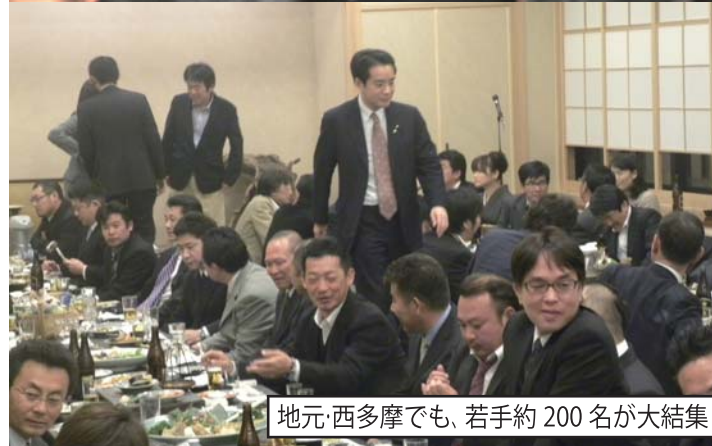
地元・西多摩でも、若手約200名が大結集