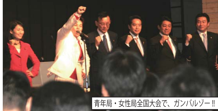
青年局・女性局全国大会で、ガンバルゾー!!