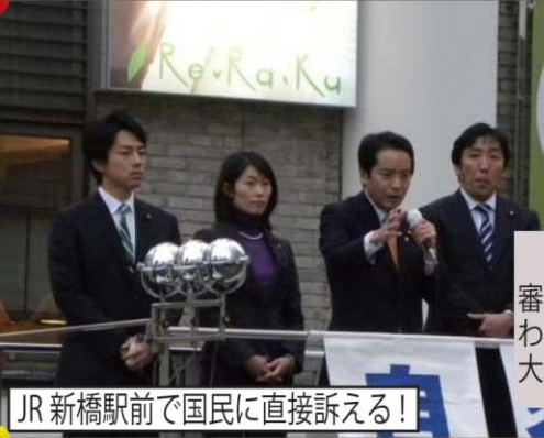
JR 新橋駅前 で国民に直接訴える！

突然事業停止を言い渡されたハツ場ダムを青梅市議会の皆さんと視察しました。多くの問題が浮き彫りに。