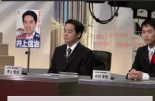
TBS-BS「われらの時代」出演

参院静岡補選に立候補した若手の仲間の応援に青年局長として現地入り。自民党も世代交代しています。