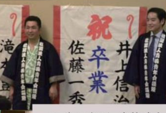
私もついに卒業です

秋晴れの下、各地の産業祭に参加しました。西多摩の素晴らしい特産物を大いに PR 致します。