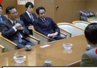
台湾大使、谷垣新総裁を表敬

与党は強行採決、野党は審議拒否では国会は何も変わりません。若手の仲間と大いに訴えました。