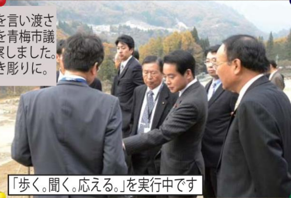
「歩く。聞く。応える。」を実行中です

突然事業停止を言い渡されたハツ場ダムを青梅市議会の皆さんと視察しました。多くの問題が浮き彫りに。