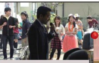
若者の自立支援、応援します！

NPO 法人青梅子ども未来の皆さんと意見交換。子ども手当より保育所や児童館の整備が最重要です。