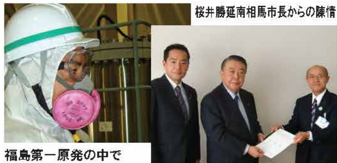
桜井勝延南相馬市長からの陳情

内閣委員長は、所管分野が極めて広く、内閣官房長官をはじめ6人の閣僚と40人の与野党議員を取りまとめる、最も困難な要職です。